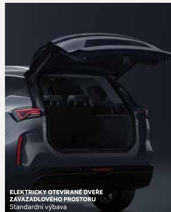
ELEKTRICKY OTEVÍRANÉ DVEŘE ZÁVAZADLOVÉHO PROSTORU Standardní výbava