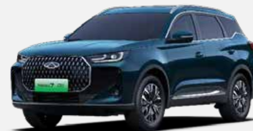
EMERALD BLUE (WE)