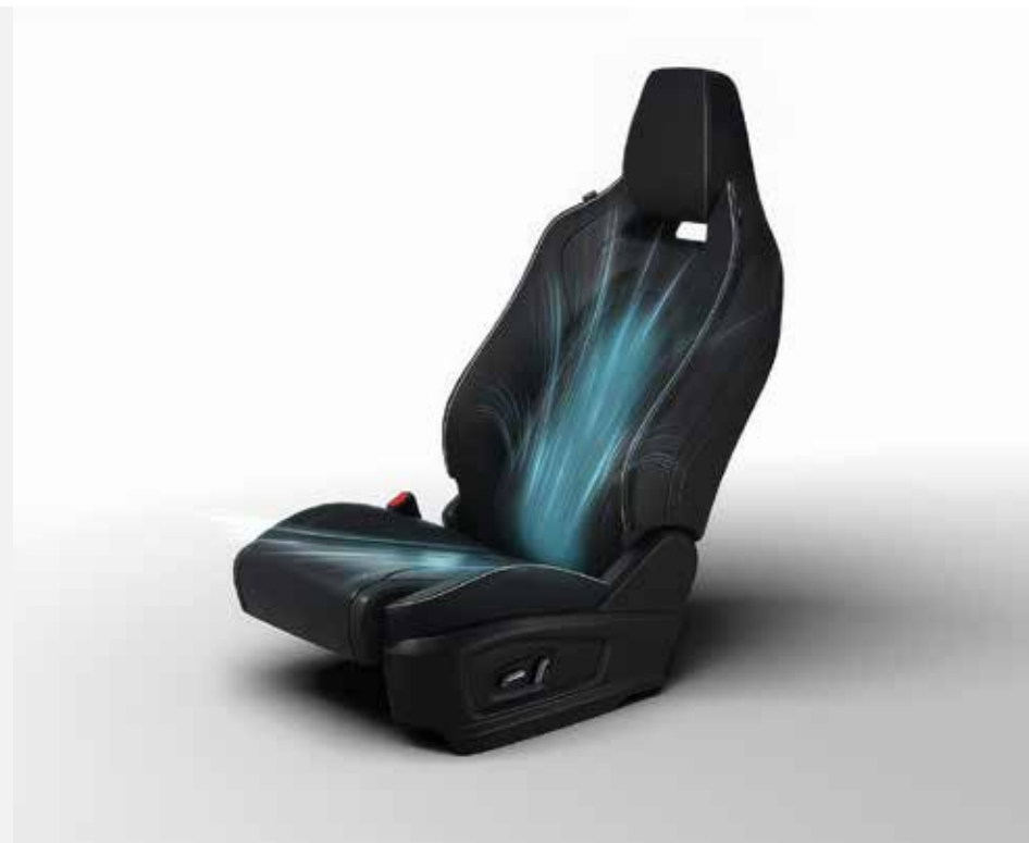
VENTILOVANÁ PŘEDNÍ SEDADLA S PAMĚTÍ POLOHY SEDADLA ŘIDIČE