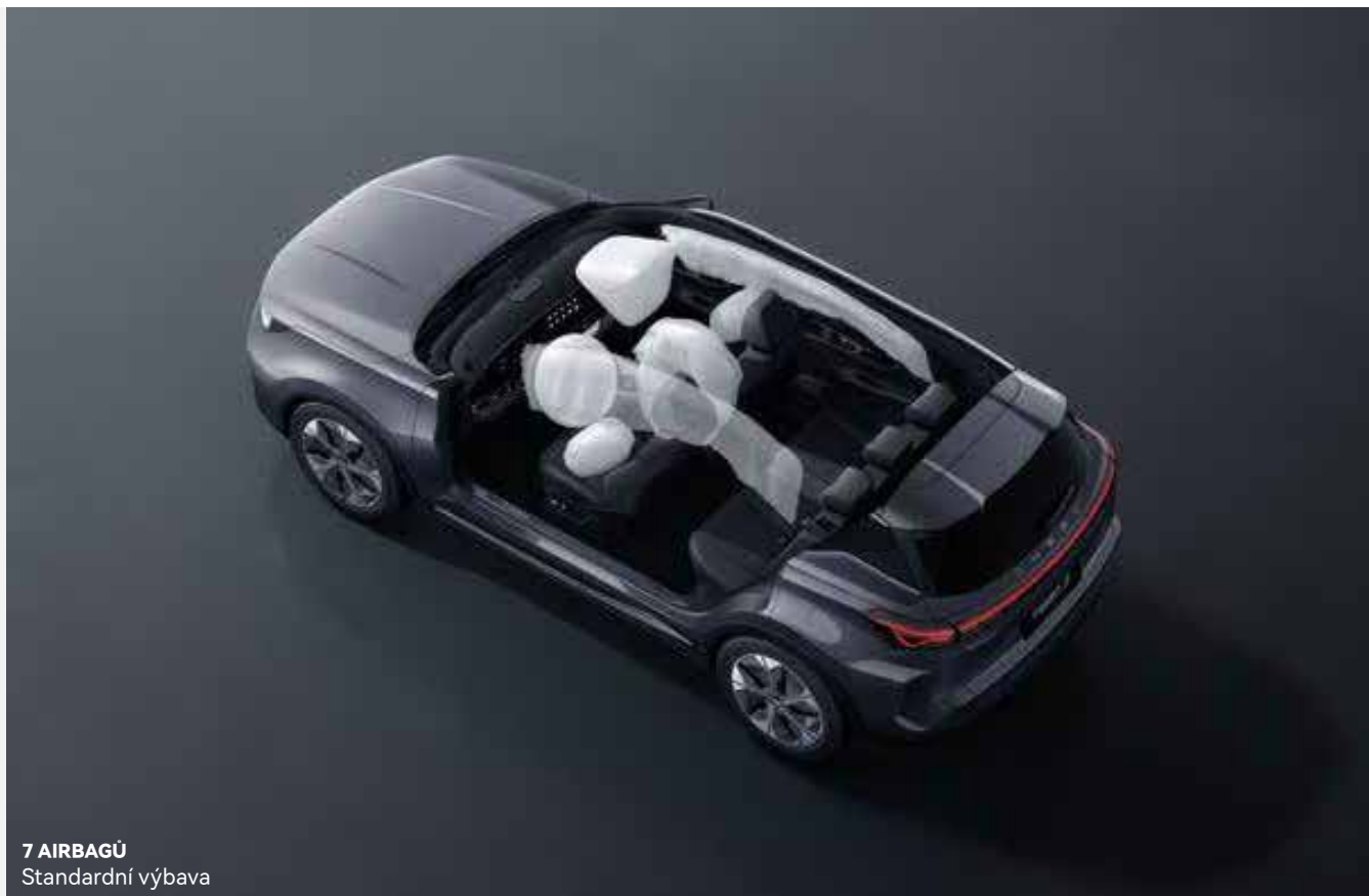
7 AIRBAGŮ Standardní výbava