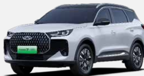
KHAKI WHITE / BLACK ROOF (ZE)