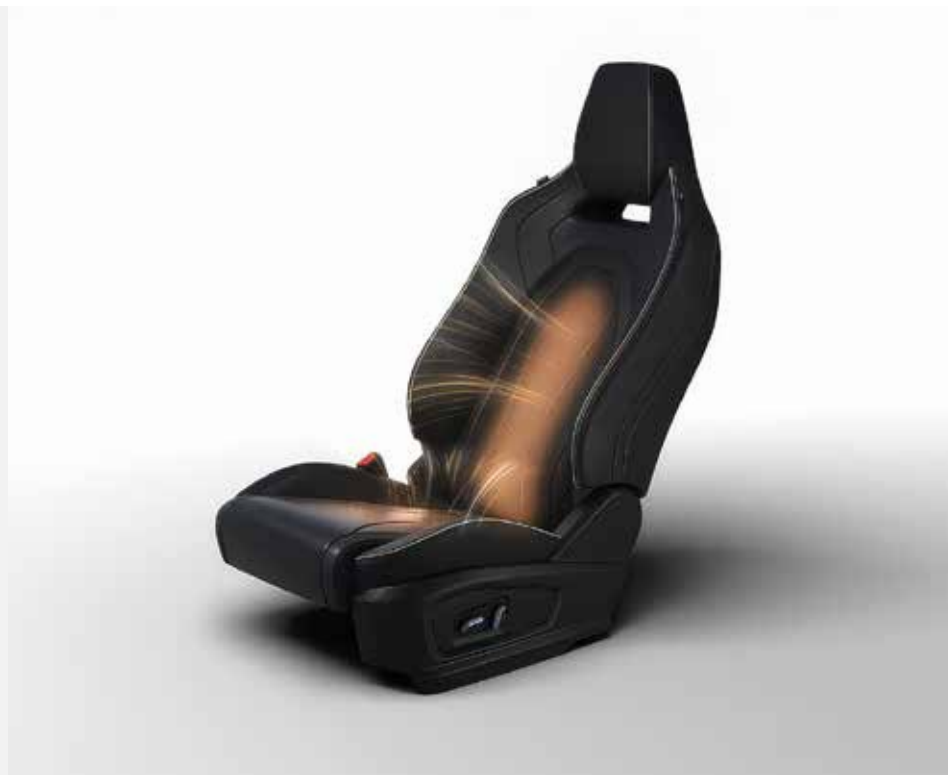
VYHŘÍVANÁ PŘEDNÍ SEDADLA S ELEKTRICKÝM NASTAVENÍM POLOHY