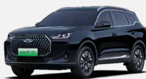
CARBON CRYSTAL BLACK (CL)