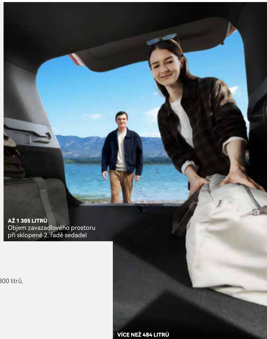
AŽ 1 305 LITRŮ Objem zavazadlového prostoru při sklopené 2. řadě sedadel