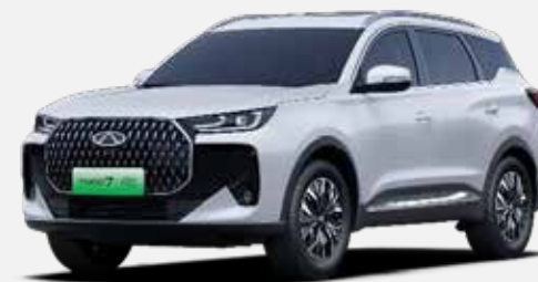
KHAKI WHITE (BW)