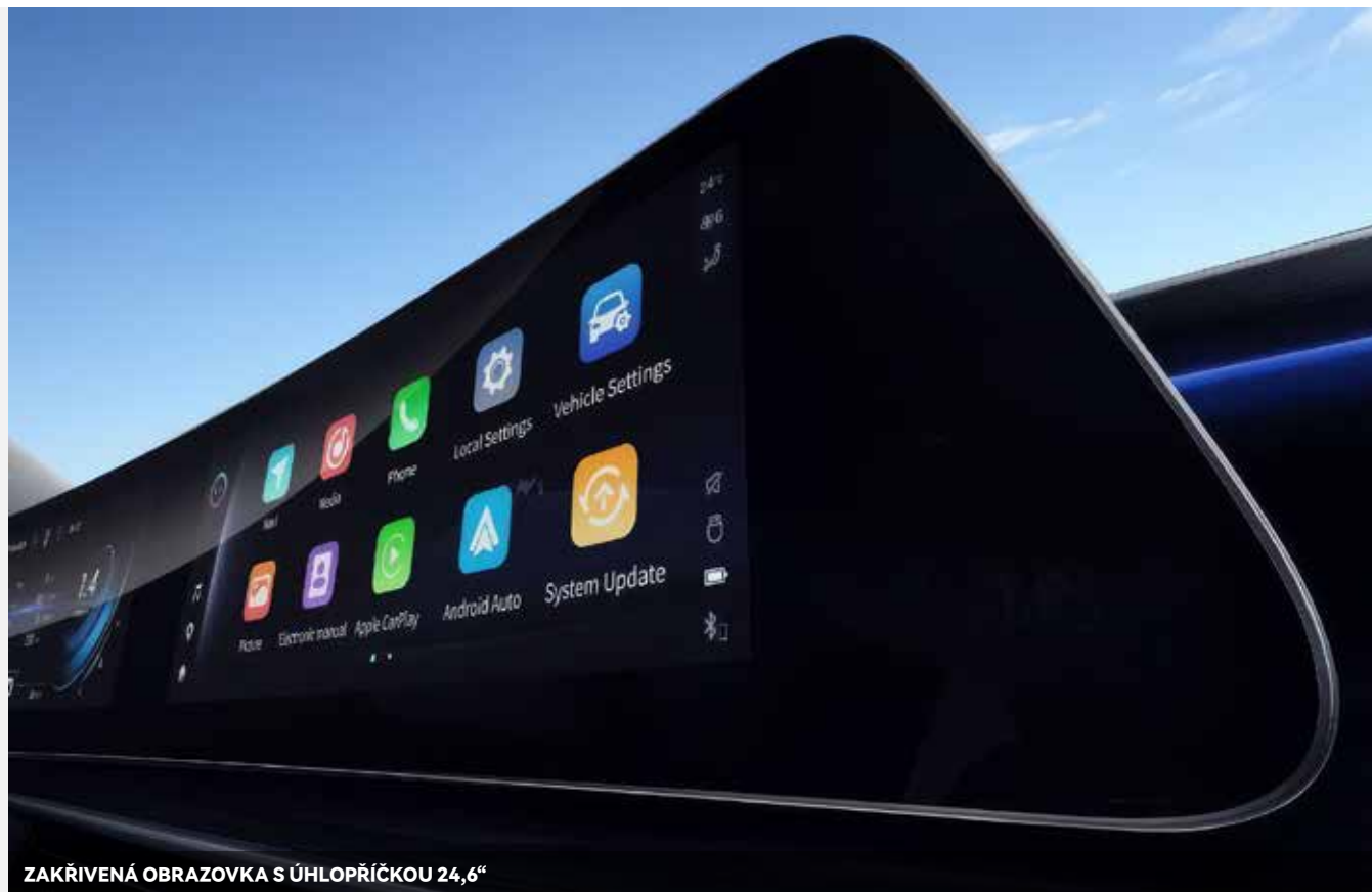
ZAKŘIVENÁ OBRAZOVKA S ÚHLOPŘÍČKOU 24,6"

Procesor Snapdragon 8155 zajišťuje výjimečný výkon a plynulost multimediálního systému. Díky němu se systém spustí za méně než 2 sekundy a je schopen zpracovat více než 20 příkazů za 30 sekund.