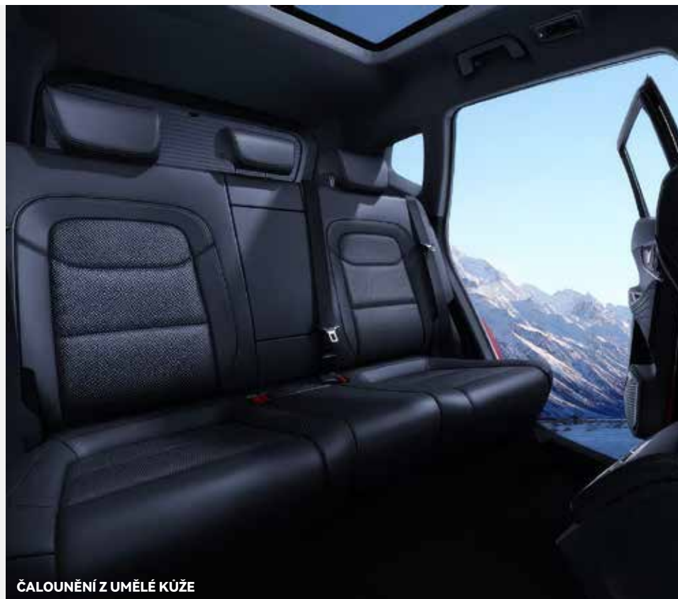
ČALOUNĚNÍ Z UMĚLÉ KŮŽE