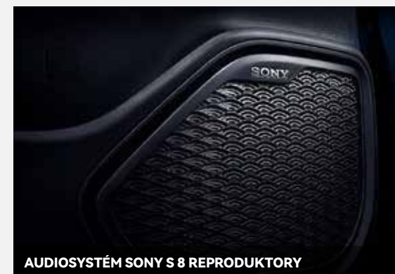
AUDIOSYSTÉM SONY S 8 REPRODUKTORY