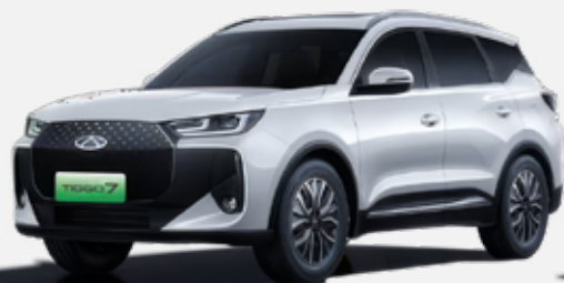
ARCTIC PLATINUM (KH)