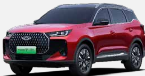
PRIME RED / BLACK ROOF (ZF)