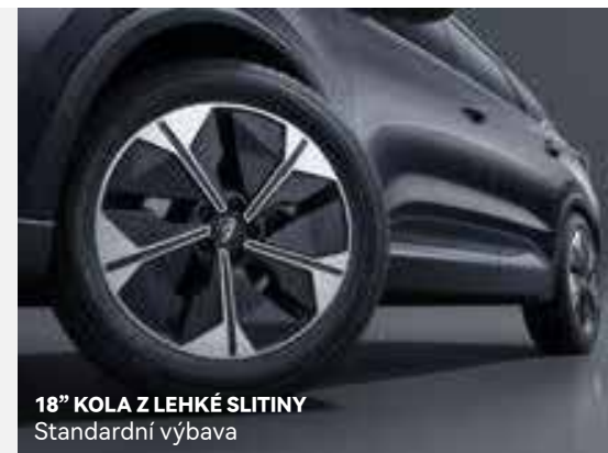
18" KOLA Z LEHKÉ SLITINY Standardní výbava