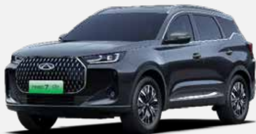
PHANTOM GRAY (GV)