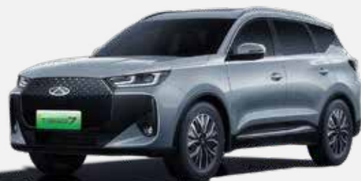
TECH GRAY (GX)